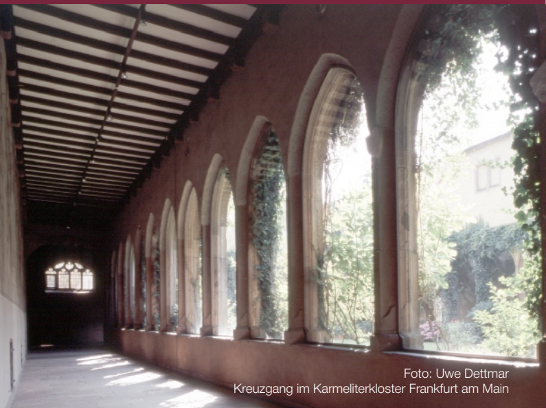
Kreuzgang im Karmeliterkloster Frankfurt am Main

Festival für Alte Musik im Rahmen des Museumsuferfestes